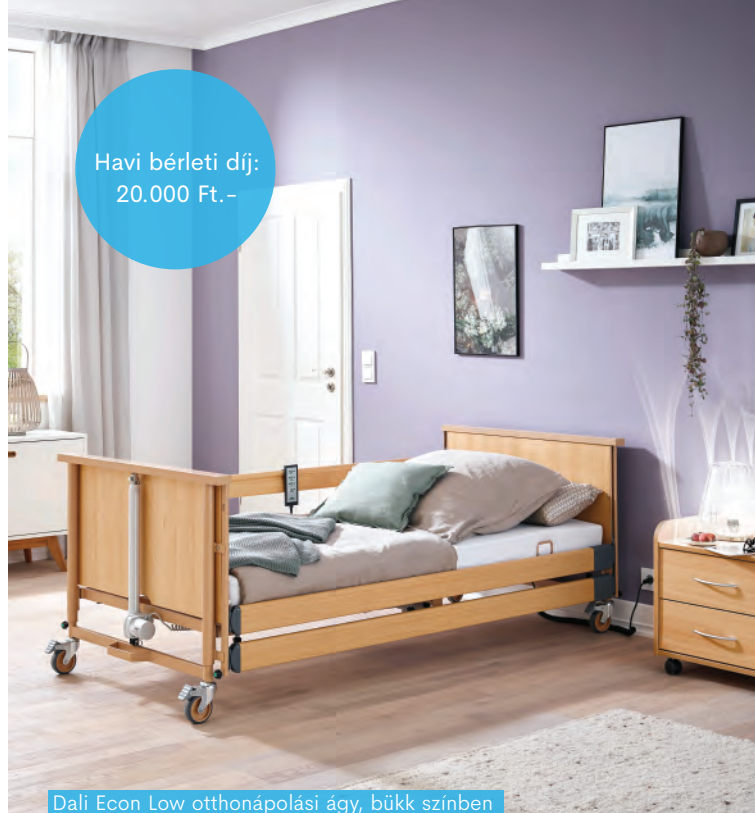
Dali Econ Low otthonápolási ágy, bükk színben