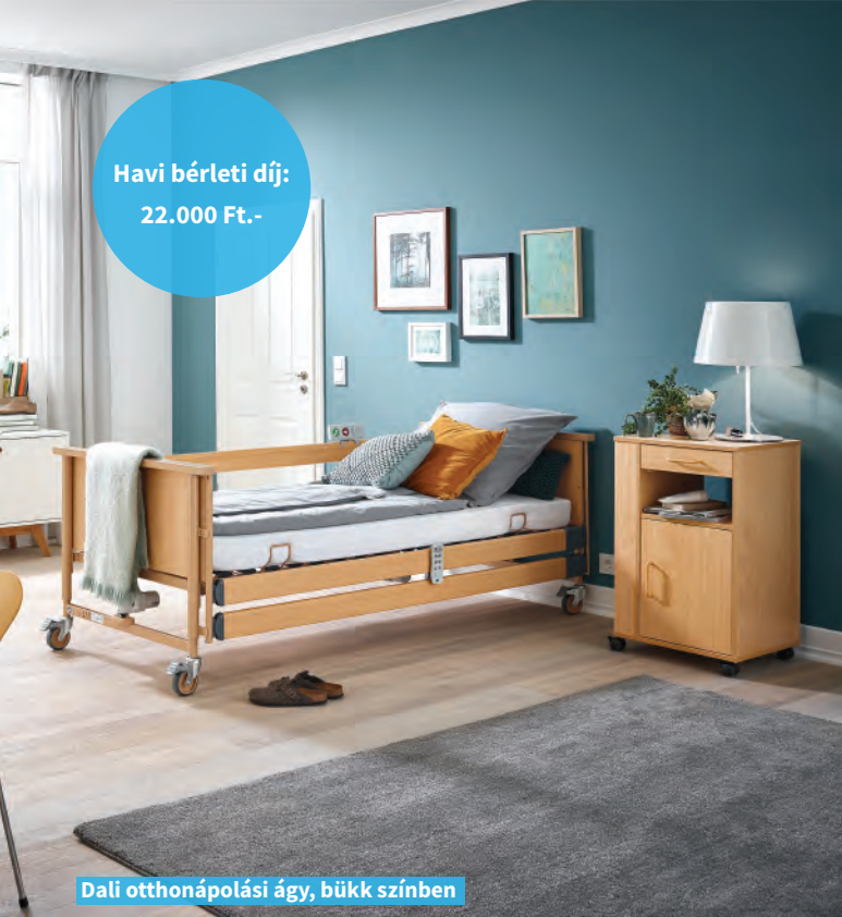
Dalí otthonápolási ágy, bükk színben