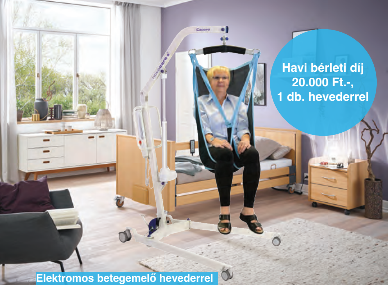
Elektromos betegemelő hevederrel