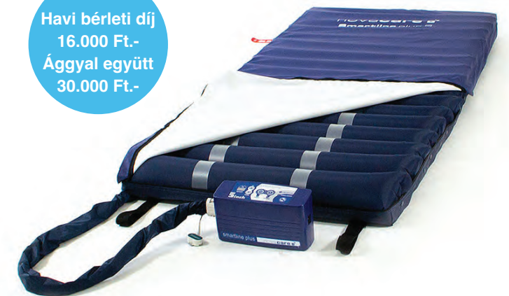
Smartline® plus 5 légpárnás matrac, kompresszorral

Havi bérleti díj 16.000 Ft.- Ágygal együtt 30.000 Ft.-