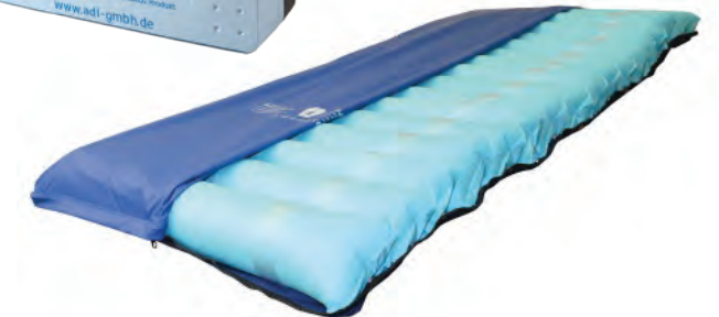
ADL Soft air WDS légpárnás matrac, kompresszorral

Havi bérleti díj 16.000 Ft.- Ágygal együtt bérelve 8.000 Ft.-