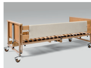
Műbőr huzat az oldalrácsához