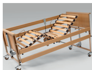
Lábradöntés (anti-Trendelenburg pozíció)