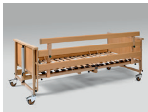
Felszerelhető oldalrács magasító