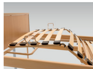
Alsó lábészemelés fogasléccel (utólag is rendelhető)