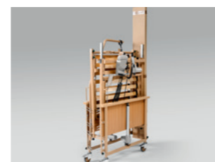
Helytakarékos, szállításhoz vagy tároláshoz szétszedhető