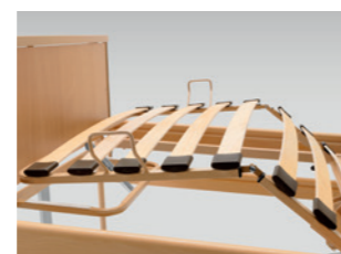
Alsó lábész állítás fogasléccel (külön rendelhető)