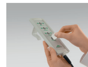
Távírányító, külön letiltható funkciókkal