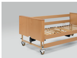
Faburkolat az emelő motorok eltakarásához (utólag is rendelhető)