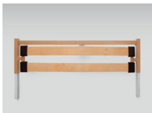
Ágyhosszabbítás (utólag is rendelhető)