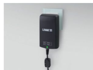
24 V-os, külső hálózati adapter