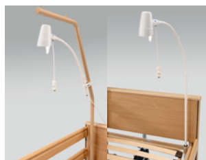
Olvasólámpa (utólag is felszerelhető)