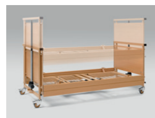
Magasságállítás 30-80 cm között