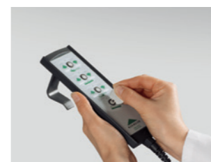
Távírányító, szelektív zárolás funkcióval