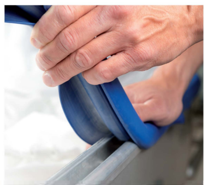
Puha, gumi peremezés