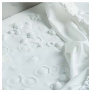
Fluidisation in progress