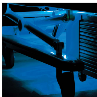
LED éjjeli fény