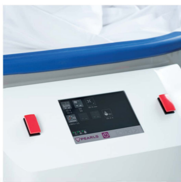
Kezelőfelület és CPR